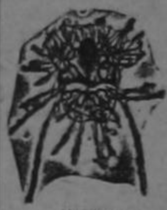
MACHO AUMENTO: 600 VECES

COBATA ESA PICAZON O RASQUINA CON EL FAMOSO ACEITE VERDE