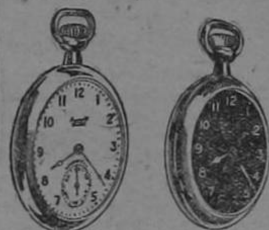
El Ingersoll con siete rubies El Radiolite con rubies

En efecto, es preferible comprar un reloj sencillo y bueno que uno de mucha apariencia y costoso, porque este muchas veces esconde grandes defectos de fabricación. El Ingersoll es el reloj apropiado para el hombre de negocios porque es el más práctico, resistente y preciso.